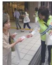
保護司として更生のお手伝い (社会を明るくする運動の街頭宣伝)