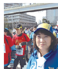
第一回目から東京マラソンの ボランティアに参加