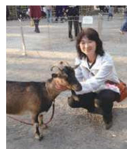
父母連会長時代から20年間 「ふれあい動物園」を開催