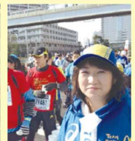
第一回目から東京マラソンの ボランティアに参加