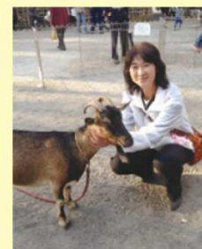
父母連会長時代から20年間 「ふれあい動物園」を開催