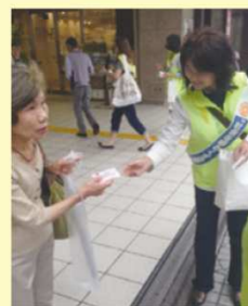
保護司として更生のお手伝い (社会を明るくする運動の街頭宣伝)