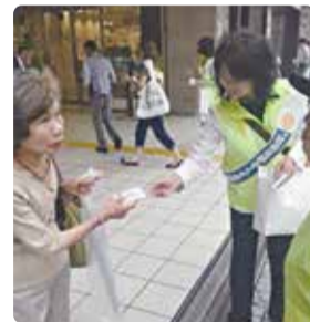
▲保護司として「社会を明るく する運動」に参加