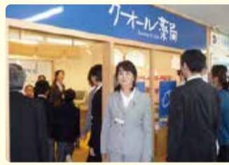
▲クオール薬局にて

しながわ子ども冒険ひろばの促進 子ども達の自主性や創造性、自己責任の意識、体力増進を目的に豊かな外遊 びをする機会を提供する「子ども冒険ひろば」を推進しました。区内では2箇所で開催 しています。