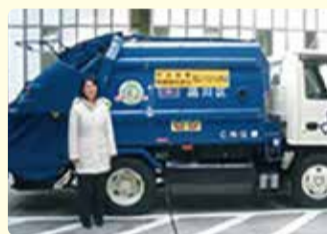
▲83運動のマスコット「ぴーびー君」