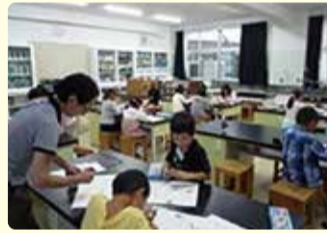
▲すまいるスクール