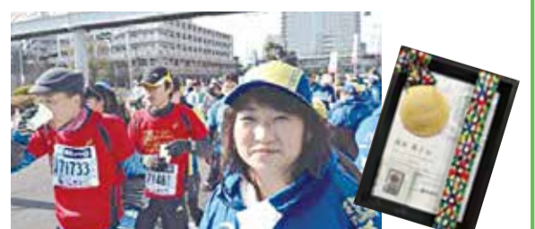
▲第1回目から東京マラソンのボランティアに参加