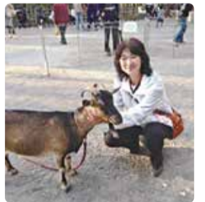
▲父母連会長時代より20年間 「ふれあい動物園」を開催