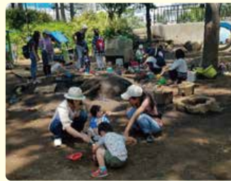
▲子ども冒険ひろば